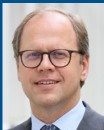
Stefan Rehder VIA GmbH