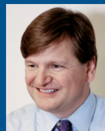
Bill Hench Royce & Associates