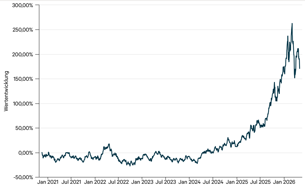
— Value Intelligence Gold Company Fonds AMI P (a)